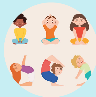
Laboratorio di espressività corporea