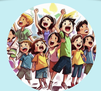
Laboratorio di attività coristiche