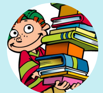
Attività di sostegno allo studio