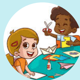
Attività ludico creative