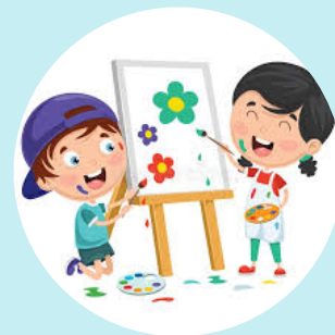
Laboratorio di arti visive