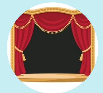
Laboratorio di teatro in Inglese